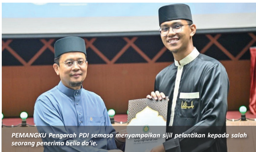
PEMANGKU Pengarah PDI semasa menyampaikan sijil pelantikan kepada salah seorang penerima belia da'ie.

memegang jawatan yang lalu. Menurut beliau, pelbagai halangan, cabaran, dugaan, rintangan, kemunduran, kegagalan dan kejayaan yang dihadapi dengan hati yang kuat juga minda yang terbuka, dalam menjalankan tugas dan amanah yang diberikan. Beliau juga mengucapkan ribuan terima kasih kepada pihak Urus Setia Program Keagamaan Belia, Pusat Da'wah Islamiah selaku penasihat Belia Da'ie kerana memberikan kepercayaan amanah dalam menjalankan pelbagai aktiviti mahupun majlis.