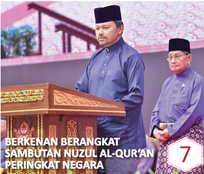
BERKENAN BERANGKAT SAMBUTAN NUZUL AL-QUR'AN PERINGKAT NEGARA