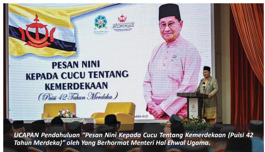
UCAPAN Pendahuluan "Pesan Nini Kepada Cucu Tentang Kemerdekaan (Puisi 42 Tahun Merdeka)" oleh Yang Berhormat Menteri Hal Ehwal Ugama.

Majlis Semarak Hari Kebangsaan Sempena Sambutan Ulang Tahun Hari Kebangsaan Negara Brunei Darussalam Ke-42, Tahun 2026 dikendalikan bersama oleh Pusat Da'wah Islamiah, Kolej Universiti Perguruan Ugama Seri Begawan, Bahagian Dasar dan Strategik dan Bahagian Pendakwa Syar'ie, KHEU. ■