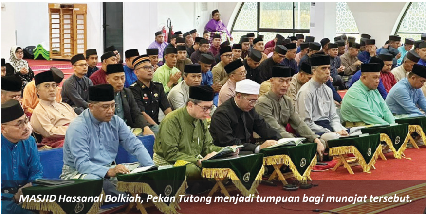
MASJID Hassanal Bolkiah, Pekan Tutong menjadi tumpuan bagi munajat tersebut.