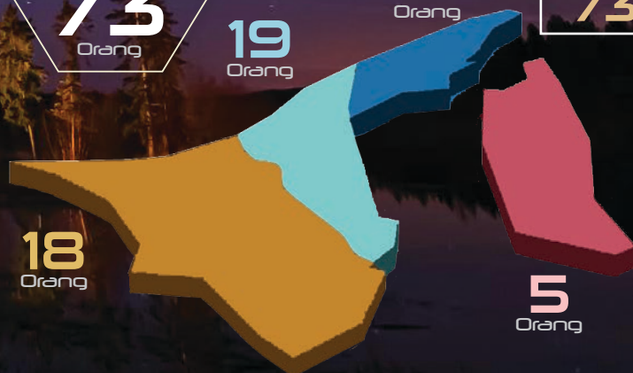
Jumlah mengikut daerah