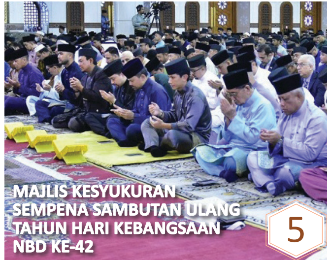
MAJLIS KESYUKURAN SEMPENA SAMBUTAN ULANG TAHUN HARI KEBANGSAAN NBD KE-42