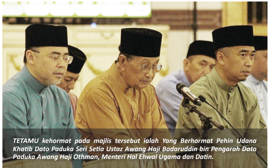
TETAMU kehormat pada majlis tersebut ialah Yang Berhormat Pehin Udana Khatib Dato Paduka Seri Setia Ustaz Awang Haji Badaruddin bin Pengarah Dato Paduka Awang Haji Othman, Menteri Hal Ehwal Ugama dan Datin.

Hadir selaku tetamu kehormat pada majlis tersebut ialah Yang Berhormat Pehin Udana Khatib Dato Paduka Seri Setia Ustaz Awang Haji Badaruddin