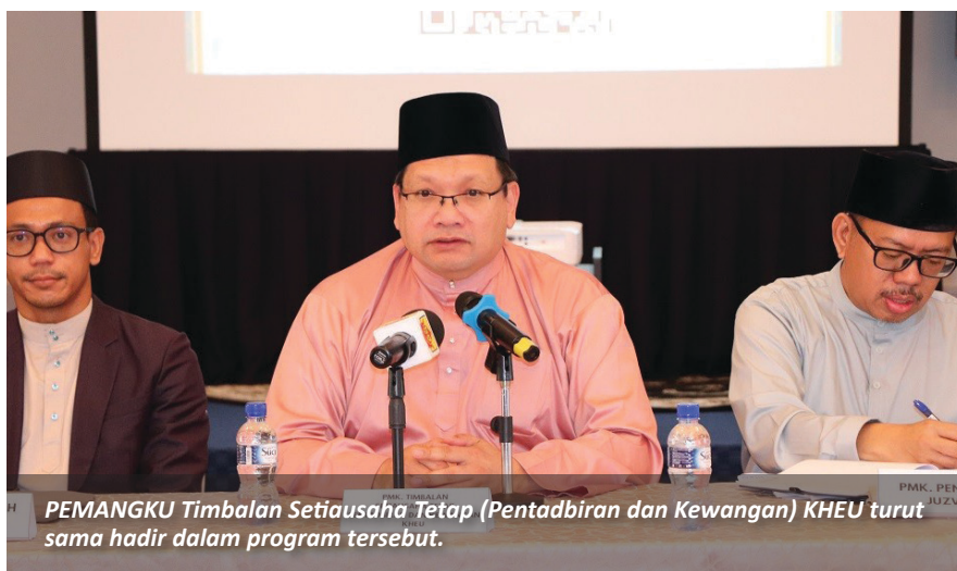
PEMANGKU Timbalan Setiausaha Tetap (Pentadbiran dan Kewangan) KHEU turut sama hadir dalam program tersebut.