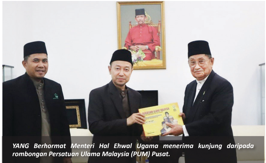
YANG Berhormat Menteri Hal Ehwal Ugama menerima kunjung daripada rombongan Persatuan Ulama Malaysia (PUM) Pusat.

Semasa kunjungan hormat, Yang Berhormat Menteri Hal Ehwal Ugama bersama Yang Di-Pertua Persatuan Ulama Malaysia berkesempatan bertukar-tukar pandangan dan berkongsi pengetahuan berkaitan perkhidmatan ugama termasuk pendidikan ugama dan arab, da'wah dan pelaksanaan perundangan Islam. Di samping mempererat hubungan silaturrahim dan jaringan keilmuan antara kedua-dua pihak, ianya turut