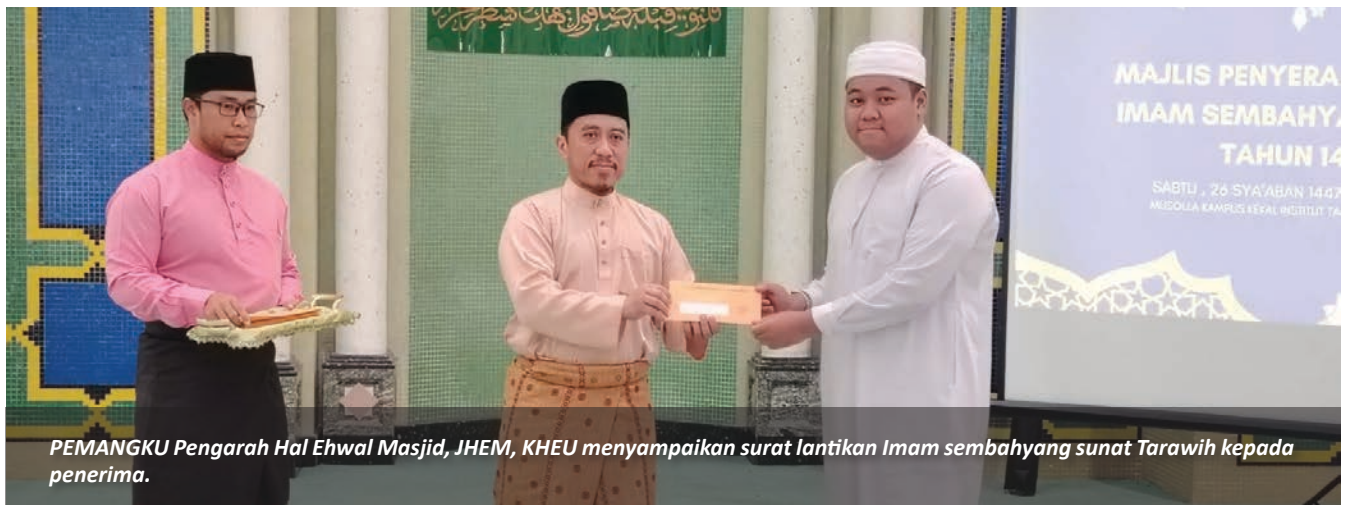
PEMANGKU Pengarah Hal Ehwal Masjid, JHEM, KHEU menyampaikan surat lantikan Imam sembahyang sunat Tarawih kepada penerima.