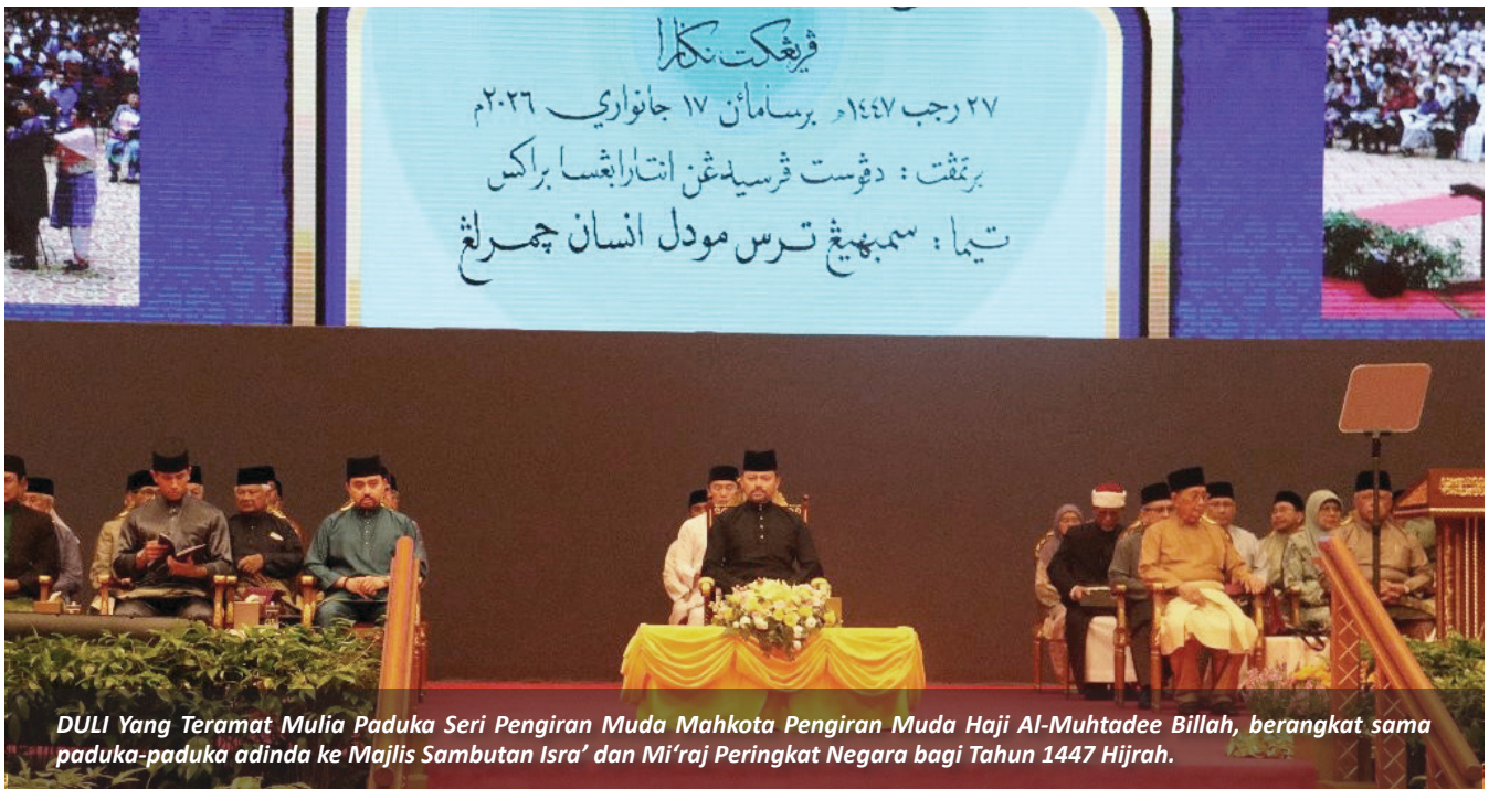
DULI Yang Teramat Mulia Paduka Seri Pengiran Muda Mahkota Pengiran Muda Haji Al-Muhtadee Billah, berangkat sama paduka-paduka adinda ke Majlis Sambutan Isra' dan Mi'raj Peringkat Negara bagi Tahun 1447 Hijrah.

BERAKAS, Sabtu, 27 Rejab bersamaan 17 Januari – Duli Yang Teramat Mulia Paduka Seri Pengiran Muda Mahkota Pengiran Muda Haji Al-Muhtadee Billah, Menteri Kanan di Jabatan Perdana Menteri berkenan berangkat ke Majlis Sambutan Isra' dan Mi'raj Peringkat Negara bagi Tahun 1447 Hijrah. Majlis berlangsung di Dewan Plenary, Pusat Persidangan Antarabangsa, Berakas.