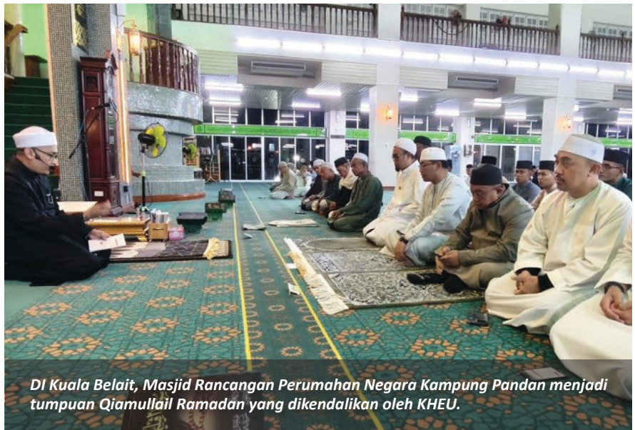
DI Kuala Belait, Masjid Rancangan Perumahan Negara Kampung Pandan menjadi tumpuan Qiamullail Ramadan yang dikendalikan oleh KHEU.