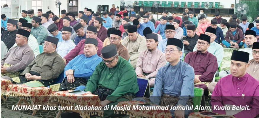
MUNAJAT khas turut diadakan di Masjid Mohammad Jamalul Alam, Kuala Belait.