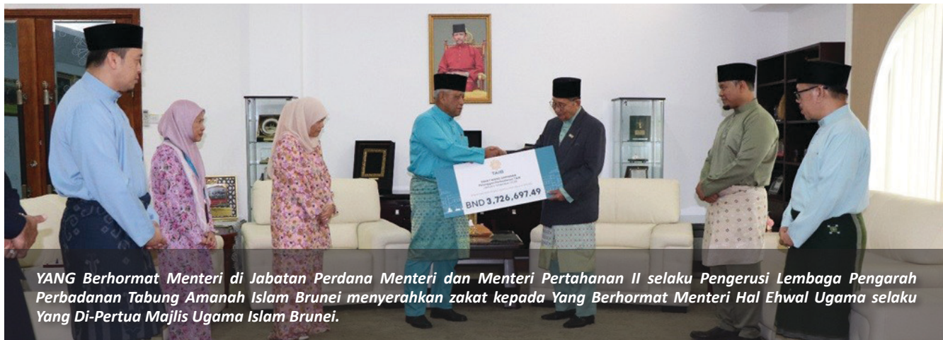
YANG Berhormat Menteri di Jabatan Perdana Menteri dan Menteri Pertahanan II selaku Pengerusi Lembaga Pengarah Perbadanan Tabung Amanah Islam Brunei menyerahkan zakat kepada Yang Berhormat Menteri Hal Ehwal Ugama selaku Yang Di-Pertua Majlis Ugama Islam Brunei.

BERAKAS, Selasa, 13 Ramadan bersamaan 3 Mac - Bulan Ramadan sering dikaitkan dengan kewajipan umat Islam menunaikan zakat, sama ada Zakat Fitrah mahupun Zakat Harta.