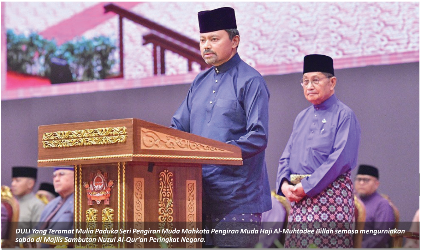
DULI Yang Teramat Mulia Paduka Seri Pengiran Muda Mahkota Pengiran Muda Haji Al-Muhtadee Billah semasa mengurniakan sabda di Majlis Sambutan Nuzul Al-Qur'an Peringkat Negara.

BERAKAS, Jumaat malam Sabtu, 17 Ramadan bersamaan 6 Mac – Duli Yang Teramat Mulia Paduka Seri Pengiran Muda Mahkota Pengiran Muda Haji Al-Muhtadee Billah ibni Kebawah Duli Yang Maha Mulia Paduka Seri Baginda Sultan Haji Hassanal Bolkiah Mu'izzaddin Waddaulah, Menteri Kanan di Jabatan Perdana Menteri berkenan berangkat ke Majlis Sambutan Nuzul Al-Qur'an Peringkat Negara Tahun 1447 Hijrah, yang berlangsung di Dewan Plenary, Pusat Persidangan Antarabangsa, Berakas.