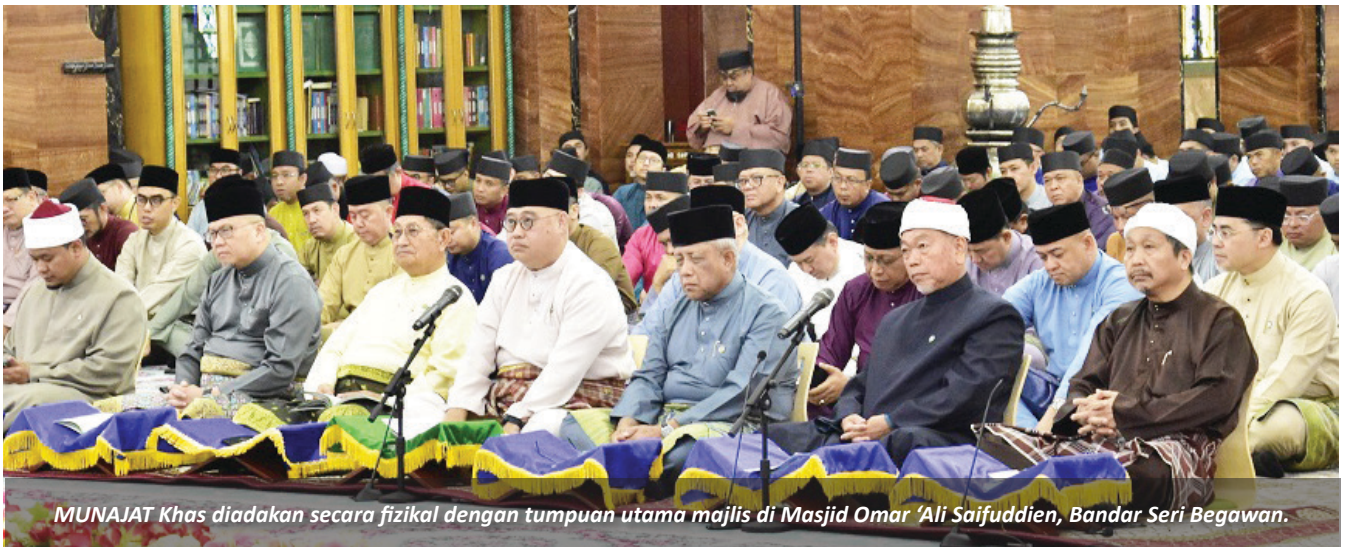
MUNAJAT Khas diadakan secara fizikal dengan tumpuan utama majlis di Masjid Omar 'Ali Saifuddin, Bandar Seri Begawan.

BANDAR SERI BEGAWAN, 6 Ramadhan bersamaan 24 Februari – Sempena Sambutan Ulang Tahun Hari Kebangsaan Negara Brunei Darussalam ke-42 (HK-42), Kementerian Hal Ehwal Ugama (KHEU) dengan kerjasama Kementerian Kebudayaan, Belia dan Sukan (KKBS) telah mengadakan Munajat Khas yang diadakan secara fizikal dengan tumpuan utama majlis di Masjid Omar 'Ali Saifuddin, Bandar Seri Begawan.