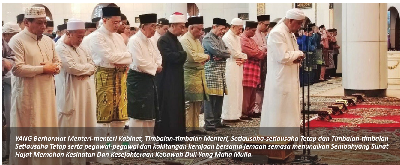
YANG Berhormat Menteri-menteri Kabinet, Timbalan-timbalan Menteri, Setiausaha-setiausaha Tetap dan Timbalan-timbalan Setiausaha Tetap serta pegawai-pegawai dan kakitangan kerajaan bersama jemaah semasa menunaikan Sembahyang Sunat Hajat Memohon Kesihatan Dan Kesejahteraan Kebawah Duli Yang Maha Mulia.

BANDAR Seri Begawan, Jumaat, 26 Rejab bersamaan 16 Januari –