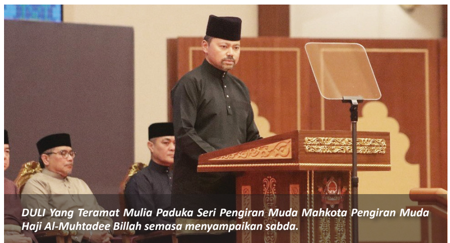
DULI Yang Teramat Mulia Paduka Seri Pengiran Muda Mahkota Pengiran Muda Haji Al-Muhtadee Billah semasa menyampaikan sabda.