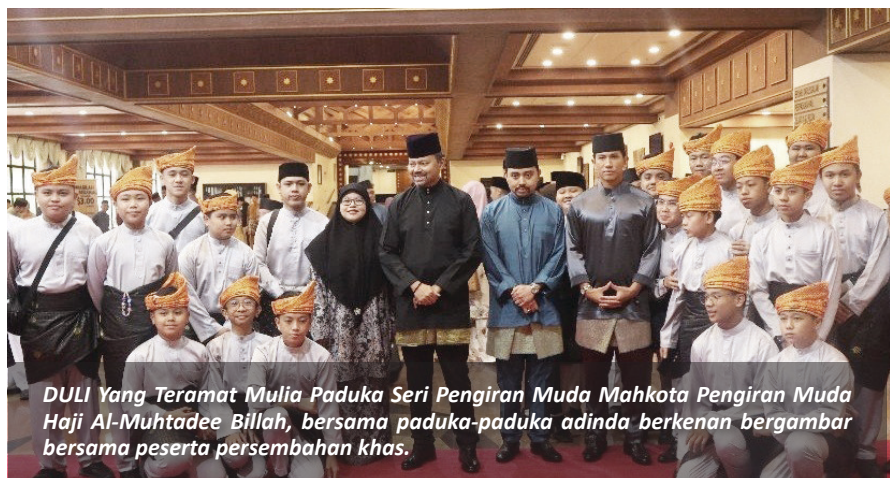
DULI Yang Teramat Mulia Paduka Seri Pengiran Muda Mahkota Pengiran Muda Haji Al-Muhtadee Billah, bersama paduka-paduka adinda berkenan bergambar bersama peserta persembahan khas.

Arab Sultan Haji Hassanal Bolkiah, Rimba.