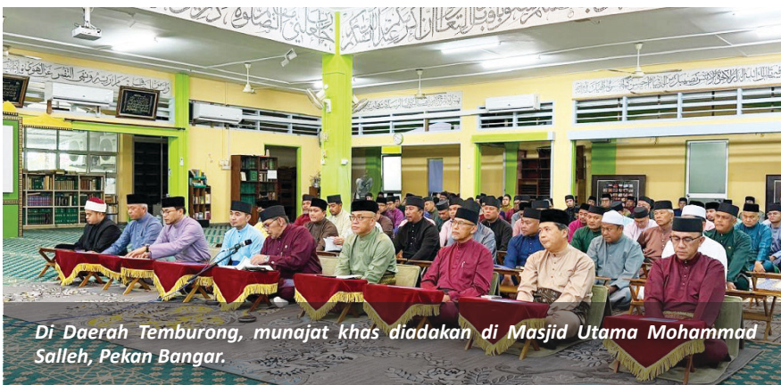
Di Daerah Temburong, munajat khas diadakan di Masjid Utama Mohammad Salleh, Pekan Bangar.

Ehwal Masjid, Kementerian Hal Ehwal Ugama.