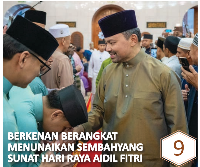
BERKENAN BERANGKAT MENUNAIKAN SEMBAHYANG SUNAT HARI RAYA AIDIL FITRI