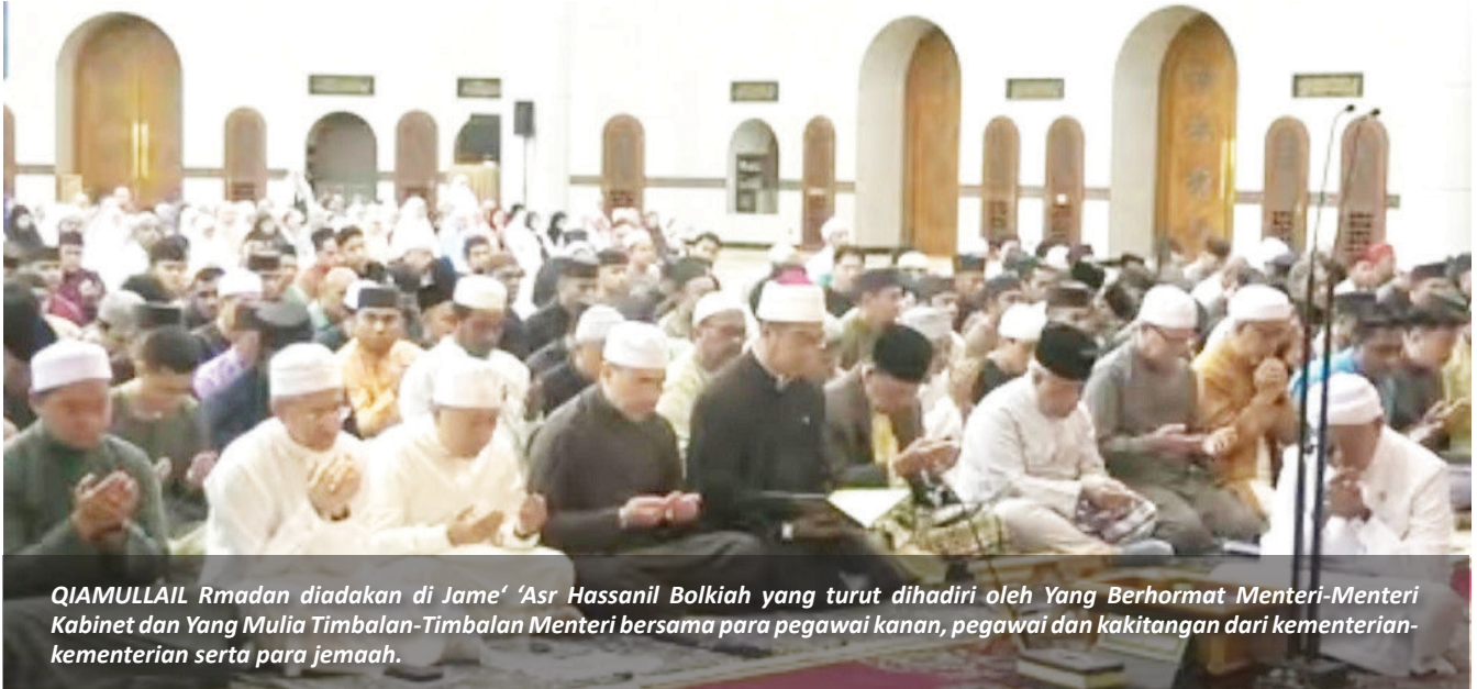
QIAMULLAIL Rmdan diadakan di Jame' 'Asr Hassanil Bolkiah yang turut dihadiri oleh Yang Berhormat Menteri-Menteri Kabinet dan Yang Mulia Timbalan-Timbalan Menteri bersama para pegawai kanan, pegawai dan kakitangan dari kementerian-kementerian serta para jemaah.

KIARONG, Ahad, 25 Ramadan bersamaan 15 Mac - Ibadah Qiamullail merupakan antara amalan sunat yang sangat dituntut dalam Islam, lebih-lebih lagi pada sepuluh malam terakhir bulan Ramadan, sebagai usaha untuk mendekatkan diri kepada Allah Subhanahu wa Ta'ala serta memohon keampunan dan rahmat daripada-Nya.