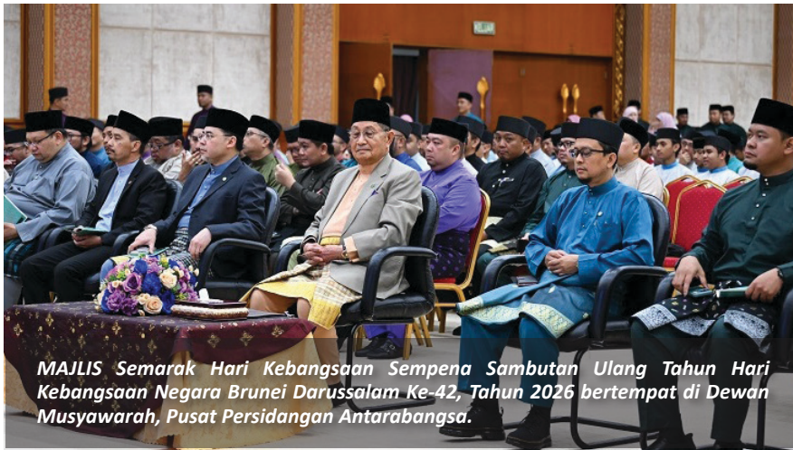
MAJLIS Semarak Hari Kebangsaan Sempena Sambutan Ulang Tahun Hari Kebangsaan Negara Brunei Darussalam Ke-42, Tahun 2026 bertempat di Dewan Musyawarah, Pusat Persidangan Antarabangsa.