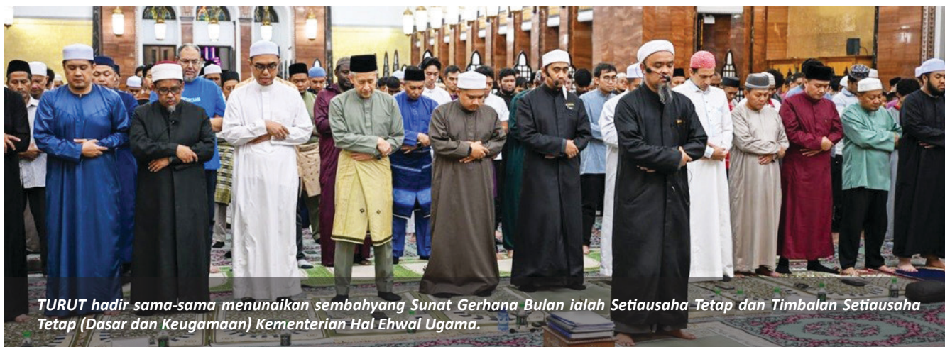
TURUT hadir sama-sama menunaikan sembahyang Sunat Gerhana Bulan ialah Setiausaha Tetap dan Timbalan Setiausaha Tetap (Dasar dan Keagamaan) Kementerian Hal Ehwal Ugama.

BANDAR SERI BEGAWAN, Selasa, 14 Ramadan bersamaan 3 Mac - Gerhana merupakan suatu kejadian yang memperlihatkan keagungan dan kebesaran Allah Subhanahu wa Ta'ala yang berlaku pada matahari dan bulan sebagai tanda atau bukti kekuasaan-Nya, sebagaimana terjadinya siang dan malam. Rasulullah Shallallahu 'alaihi wa sallam menganjurkan umat Islam agar memperbanyakkan amalan kebajikan seperti menunaikan sembahyang, berdoa, berzikir, bersedekah dan beristighfar apabila berlakunya gerhana.