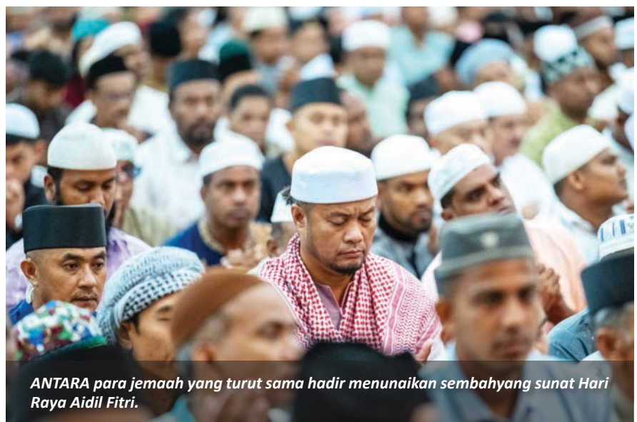
ANTARA para jemaah yang turut sama hadir menunaikan sembahyang sunat Hari Raya Aidil Fitri.