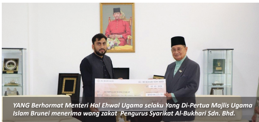
YANG Berhormat Menteri Hal Ehwal Ugama selaku Yang Di-Pertua Majlis Ugama Islam Brunei menerima wang zakat Pengurus Syarikat Al-Bukhari Sdn. Bhd.

Umat Islam di negara ini diseru agar menunaikan kewajipan berzakat apabila telah cukup nisab dan haul. Di samping memenuhi tanggungjawab sebagai seorang muslim, zakat juga merupakan tanggungjawab sosial dalam usaha bersama membantu golongan yang memerlukan, khususnya asnaf fakir dan miskin di Negara Brunei Darussalam. ■