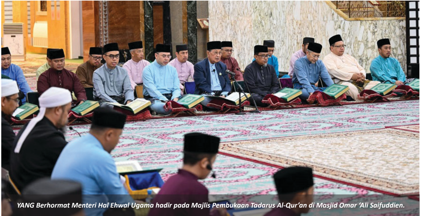
YANG Berhormat Menteri Hal Ehwal Ugama hadir pada Majlis Pembukaan Tadarus Al-Qur'an di Masjid Omar 'Ali Saifuddien.

Oleh : Hajah Ratna Wati Haji Abdul Karim