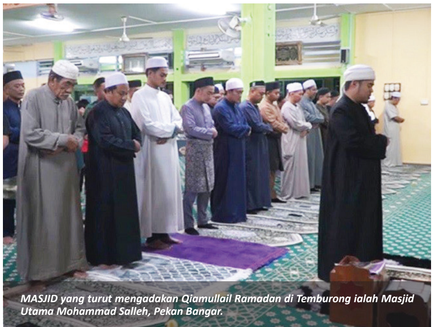
MASJID yang turut mengadakan Qiamullail Ramadan di Temburong ialah Masjid Utama Mohammad Salleh, Pekan Bangar.