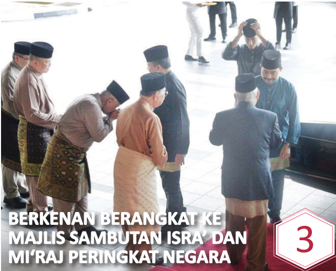
BERKENAN BERANGKAT KE MAJLIS SAMBUTAN ISRA' DAN MI'RAJ PERINGKAT NEGARA