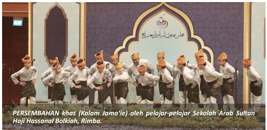
PERSEMBAHAN khas ( Kalam Jama'ie ) oleh pelajar-pelajar Sekolah Arab Sultan Haji Hassanal Bolkiah, Rimba.